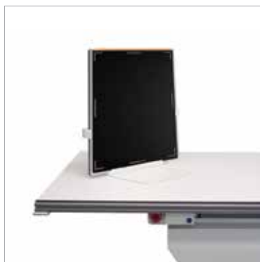
Detector de mesa/Suporte do cassette