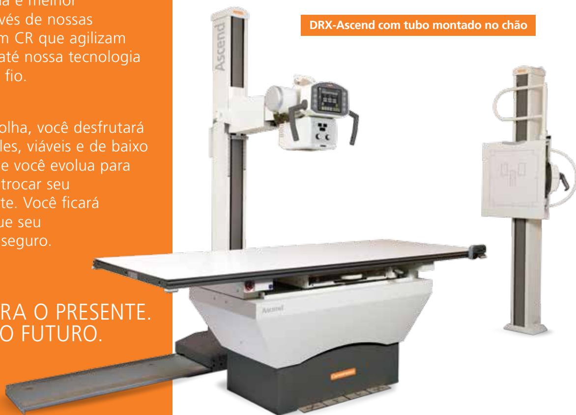
DRX-Ascend com tubo montado no chão