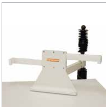
Detector lateral/Suporte do cassette