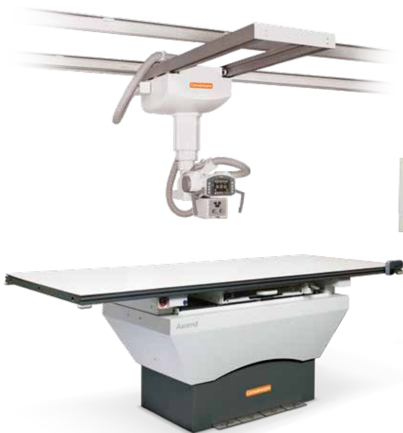
DRX-Ascend com tubo montado no teto

Boas notícias? Seja qual for o resultado dessa avaliação, há uma configuração Ascend que oferece a combinação ideal.