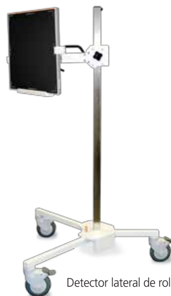
Detector lateral de rolagem/Suporte do cassette