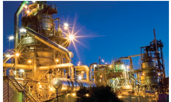
Industrie du pétrole et du gaz