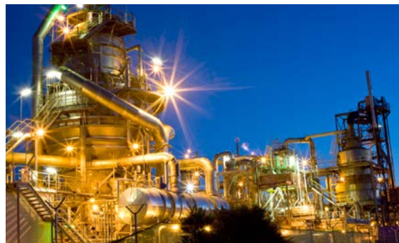
Petróleo e gás