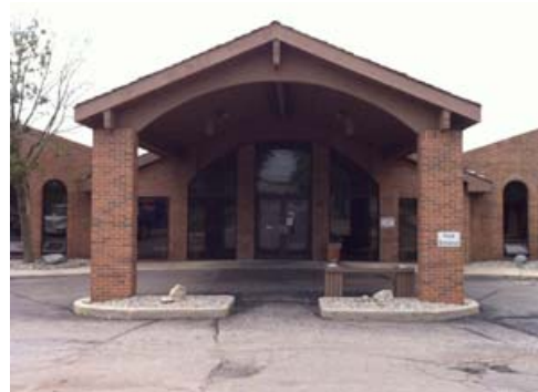
El centro radiológico del Community Open MRI Group en Fort Wayne, Indiana

El centro radiológico de Fort Wayne buscaba inicialmente una nueva impresora que ofreciera una mejor calidad de imagen. Los radiólogos que interpretaban estudios para el centro recomendaron las impresoras láser CARESTREAM DRYVIEW porque producían imágenes de excelente calidad.