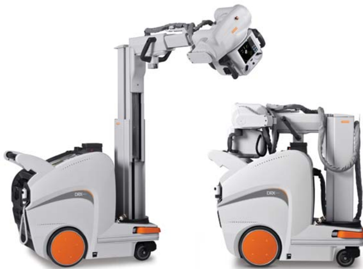
DRX-Revolutionin sisäänlaskeutuva pilari helpottaa laitteiston siirtämistä.

Nopeuta toimintaasi ja tehosta potilaiden hoitoa. Liity nyt vallankumoukseen. Valitse DRX-Revolution.