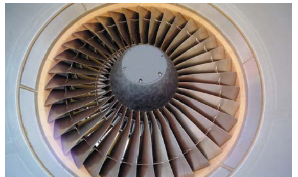
Luft- und Raumfahrt