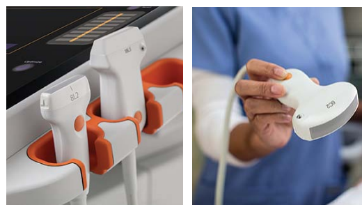
Abbildungen 11 und 12: Der Ultraschall-experte kann über eine eingebaute Smart Select-Taste die ausgewählte Ultraschallsonde einstellen.

Über die Smart Select -Taste auf jeder Ultraschallsonde kann der Ultraschall-experte die gewünschte Sonde direkt über die Sonde selbst auswählen.