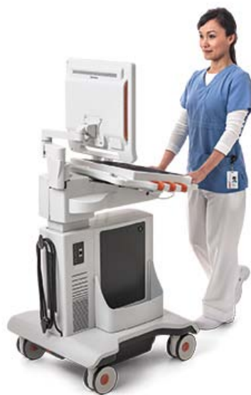
Abbildung 9: Die meisten Anwender können beim Schieben über das Touch Ultrasound-Gerät schauen.

Das Ultraschallsystem muss auf verschiedenen Untergründen und über Schwellen hinweg problemlos transportiert werden können. Auch die Neupositionierung während einer Untersuchung sollte kein Problem darstellen. Die Höhe des Systems beim Transport sollte so niedrig sein, dass die meisten Anwender über das Gerät schauen können.