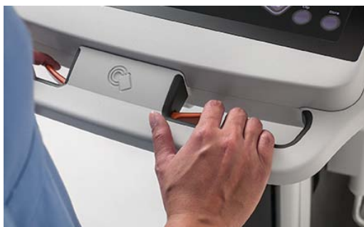
Abbildung 8: Die Höhensteuerung des Systems kann problemlos bedient werden, ohne dass das Handgelenk unnatürlich belastet wird.

Das Ultraschallsystem muss auf verschiedenen Untergründen und über Schwellen hinweg problemlos transportiert werden können. Auch die Neupositionierung während einer Untersuchung sollte kein Problem darstellen. Die Höhe des Systems beim Transport sollte so niedrig sein, dass die meisten Anwender über das Gerät schauen können.