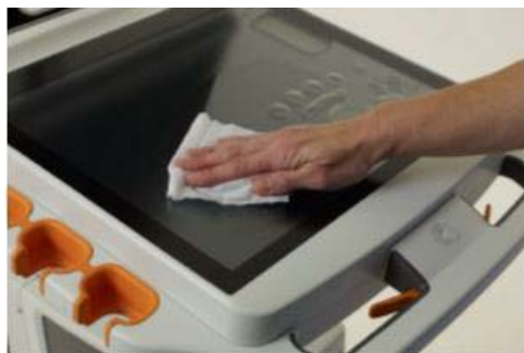
Abbildung 14: Das Bedienfeld lässt sich zwischen Untersuchungen problemlos reinigen.

Dank der flachen Oberfläche des Bedienfelds lässt es sich schnell und einfach mehrmals täglich reinigen. Diese Funktion entspricht oder übertrifft unter Umständen die Infektionsschutzrichtlinien der meisten Einrichtungen.