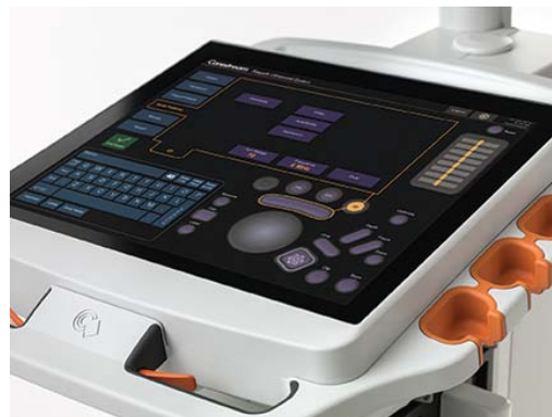
Abbildung 2: Die am häufigsten verwendeten Steuerungen werden in Gruppen um den Trackball herum angeordnet, der als Touch-Funktion vollständig in das Bedienfeld integriert ist. Das Bedienfeld kann bei der Positionierung des Systems im Untersuchungsraum ganz flexibel von links nach rechts geschoben werden.

Die am häufigsten verwendeten Tasten sollten sich direkt vor dem Ultraschallexperten befinden. Dies lässt sich problemlos realisieren, wenn das Bedienfeld horizontal von rechts nach links verschoben werden kann. Durch die Anordnung funktionsähnlicher Steuerungen in Gruppen sind die entsprechenden Tasten leichter erreichbar und lassen sich leichter finden. Dank der intuitiven Funktionen werden Frustrations- und Stresslevel beim Ultraschallexperten reduziert, beides Faktoren, die das Risiko von arbeitsbedingten Erkrankungen des Bewegungsapparats erhöhen.