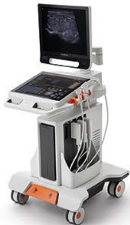
Abbildung 1: Das CARESTREAM Touch Ultrasound System verfügt über ein voll bewegliches Bedienfeld, wodurch das System in die für den Anwender optimale Position geschwenkt werden kann.

Zu den Funktionen, die zu einer bequemen Arbeitshaltung beitragen, gehören die Funktionen, mit denen der Ultraschallexperte das System nahe am Untersuchungstisch positionieren und den Monitor frontal im Blickfeld aufstellen kann. Dank des voll beweglichen Bedienfelds, kann der Ultraschallexperte dieses zu sich heranziehen und seitlich verschieben, ohne das gesamte System bewegen zu müssen.