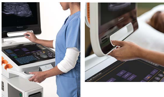
Abbildungen 4 und 5: Dank des Griffs kann der Ultraschall-experte den Monitor problemlos mit einer Hand positionieren.

Der Monitor des Systems sollte ebenfalls voll beweglich sein und sich leicht in die optimale Position bringen lassen. Dem Ultraschall-experten fällt es leichter, den Monitor zu positionieren, wenn er dies während der Untersuchung mit einer Hand machen kann. Die Positionierung mit einer Hand ist dank des Griffs am unteren Monitorrahmen möglich.