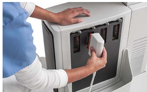
Abbildungen 6 und 7: Wenn mehrere Ultraschallsonden-Anschlüsse vorhanden sind, muss die Sonde bei einem Wechsel nicht neu angeschlossen werden. Somit ist der Wechsel der Ultraschallsonde problemlos mit einer Hand möglich.

Das Einstellen der Höhe ist bei Ultraschallsystemen eine weitere wichtige ergonomische Funktion. Dank eines großzügigen Höheneinstellungsbereichs kann den Arbeitsanforderungen einer Vielzahl von Mitarbeitern Rechnung getragen werden, ganz unabhängig von der Körpergröße oder davon, ob bestimmte Untersuchungen im Stehen durchgeführt werden müssen. Bei einem System, das für unterschiedlichste Untersuchungen eingesetzt wird, sollte die Höhe entsprechend gering eingestellt werden können, damit auch Untersuchungen bei venösem Rückfluss durchgeführt werden können, bzw. entsprechend hoch eingestellt werden können, um geburtshilfliche Untersuchungen oder Unterbauchuntersuchungen durchführen zu können. Die Höhe des Systems muss ohne Beuge- oder Streckbewegung des Handgelenks eingestellt werden können.