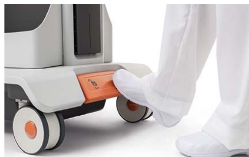
Abbildung 10: Das Bremspedal des Touch Ultrasound Systems ist ideal positioniert und leicht erreichbar.

Das Bremspedal muss leicht erreichbar sein und darf das System beim Schieben nicht behindern.